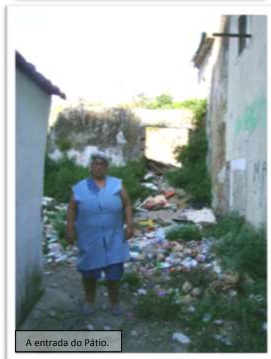
A entrada do Pátio.