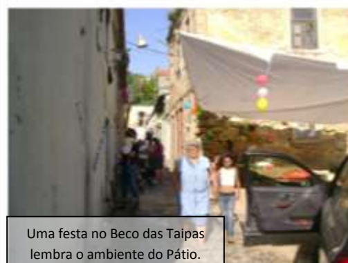
Uma festa no Beco das Taipas lembra o ambiente do Pátio.